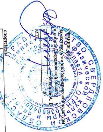
СПИСОК кандидатов в спортивную сборную команду Свердловской области по Боевому на 2022 год